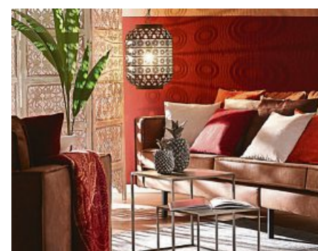
Holen Sie sich fernöstliches Ambiente in die eigenen vier Wände. In unseren Wohnwelten stehen Ihnen dafür zahlreiche Elemente des asiatischen Einrichtungsstils zur Verfügung.