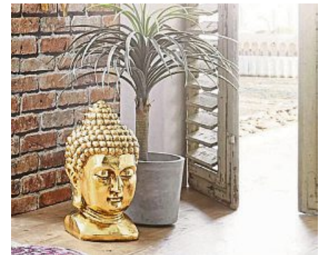
Typisch für den Asien-Style: Buddha-Figuren. Sie machen den Wohn- oder Gartenbereich zu einem Ort für mehr Harmonie, Ruhe und Gelassenheit.

tenden Wohn-Accessoires wie bodennahen Beistelltischen, dekorativen Vasen, fein bestickten Kissen und Decken aus Seide sowie stimmungsvollen Leuchten werden Ihr Wohn- oder Schlafzimmer zu Orten für mehr Harmonie, Ruhe und Gelassenheit. Auch im heimischen Garten kann der asiatische Einrichtungsstil Einzug finden. Machen