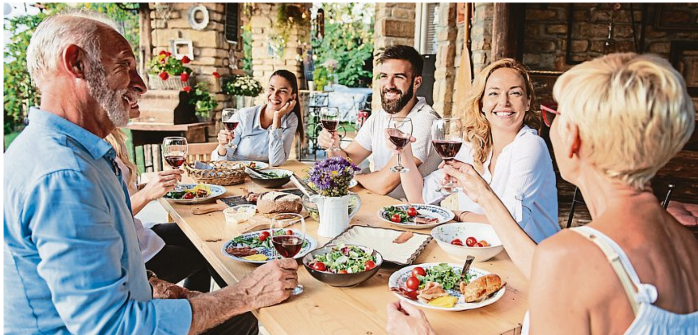
Auch zu Hause kann man den mediterranen Lifestyle genießen, zum Beispiel mit einem gemeinsamen Essen am rustikalen Holztisch.

Sie lieben das Mittelmeer, werden dieses Jahr aber nicht dorthin verreisen können? Dann holen Sie sich doch etwas mediterranen Lifestyle in die eigenen vier Wände. Das gelingt Ihnen mit Möbeln und Wohn-Accessoires aus Holz, Rattan, Leinen und Terrakotta. Warme erdige Farben und helle Naturtöne bestimmen außerdem die Einrichtung, ebenso wie Blau- und Grüntöne. Textilien und Teppiche dürfen zudem üppig und farbenfroh gemustert sein. Auch der Outdoor-Bereich eignet sich gut dafür, eine mediterrane Atmosphäre zu kreieren, beispielsweise mit Gartenmöbeln aus Korbgeflecht, Holz oder Eisen sowie Blumentöpfen, Kübeln und Schalen aus Terrakotta.