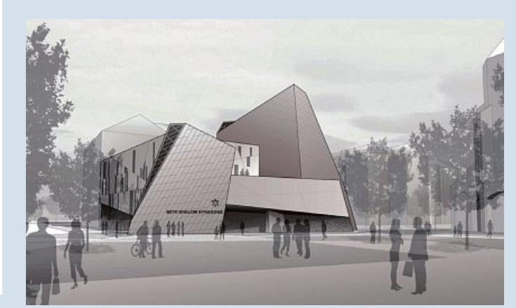
Die Spitze des Zentrums der liberalen jüdischen Gemeinde Beth Shalom soll 23 Meter hoch werden. Es liegt im Lehel zwischen Widenmayer- und Oettingenstraße. Geplant sind auch eine Kita und zwölf Wohnungen.

So hat Beth Shalom die eigenen Nutzungsflächen auf rund 35 Prozent des Gesamtvolumens reduziert. Ein Viertel der Fläche ist für eine Kita reserviert, auf den restlichen 40 Prozent entstehen zwölf Wohnungen. Beth Shalom ist in den vergangenen fünf Jahren enorm von 400 auf aktuell 600 Mitglieder