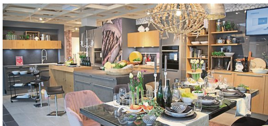
Neben der persönlichen Traumküche mit ausgeklügelter, smarter und leicht bedienbarer Technik finden Daheimgebliebene bei XXXLutz auch eine große Auswahl an Produkten rund ums Essen und Kochen.

Weitere Einrichtungsideen, Angebote und Informationen unter www.xxxlutz.de